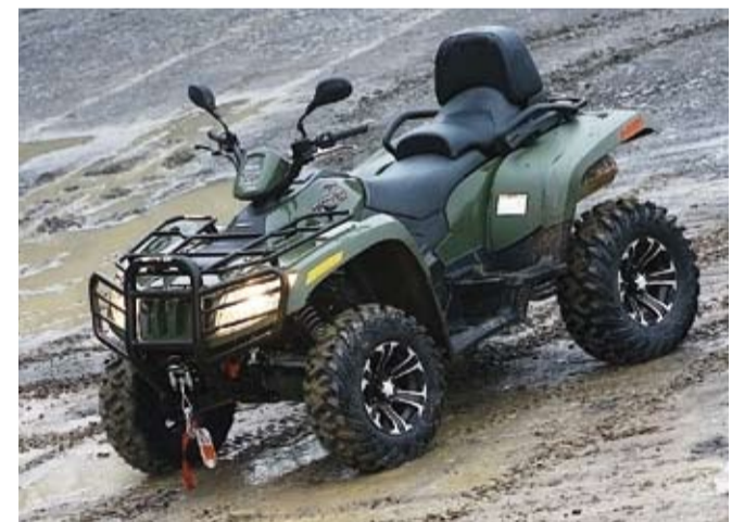
Ty kola jí fakt seknu, co?