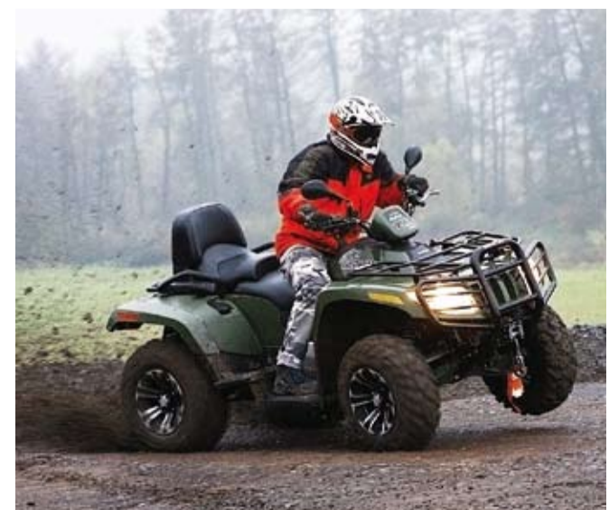
Nekoukejte, jak blbnu, spíš si všimněte víčka nádrže na blatníku. Nádrž je vzadu a hodně nízko, aby snižovala polohu těžiště